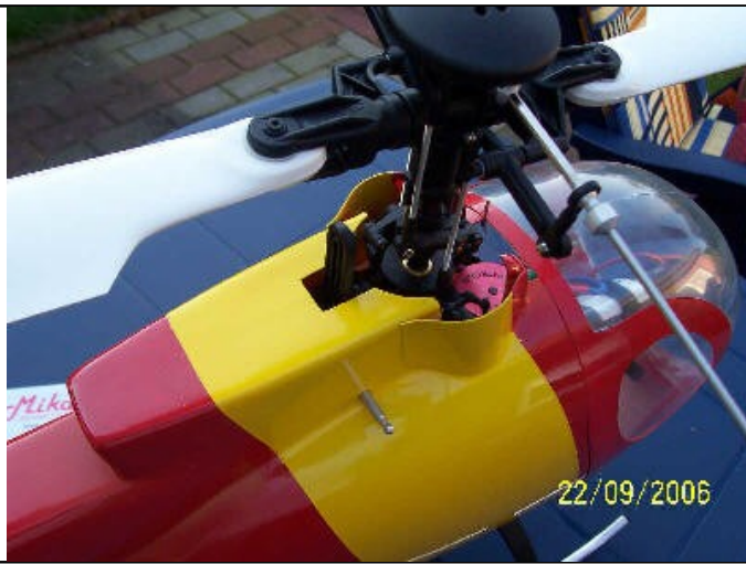
Bild 7 zeigt den Hauptrotor mit Taumelscheibe und die original Haubenbefestigung.