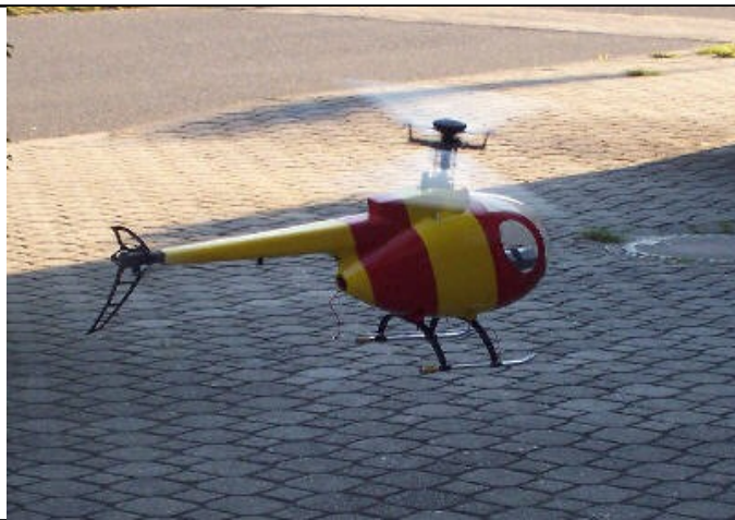
Bild 9 zeigt den Hughes 500 im Flug.

Bild 8 hier sieht man den fertigen Hughes 500 mit eingebautem Akku.