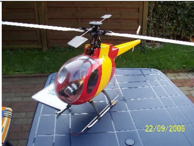
Bild 8 hier sieht man den fertigen Hughes 500 mit eingebautem Akku.

Bild 7 zeigt den Hauptrotor mit Taumelscheibe und die original Haubenbefestigung.